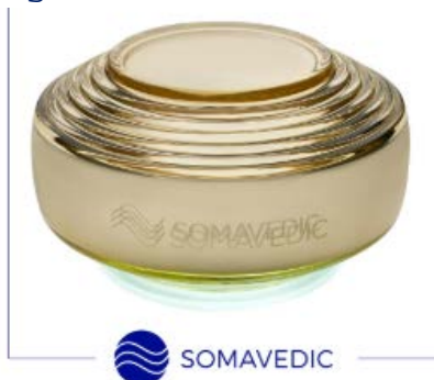
Somavedic Medic Amber Champaign

Seine Wirkung ist 4-mal stärker als die von Medic Uran.