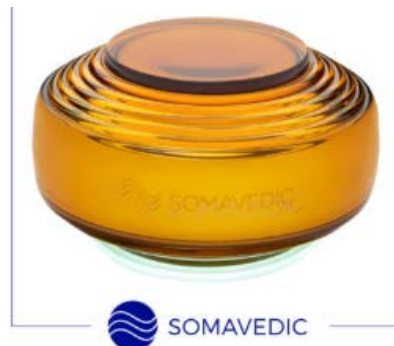
Somavedic Medic Amber Honig