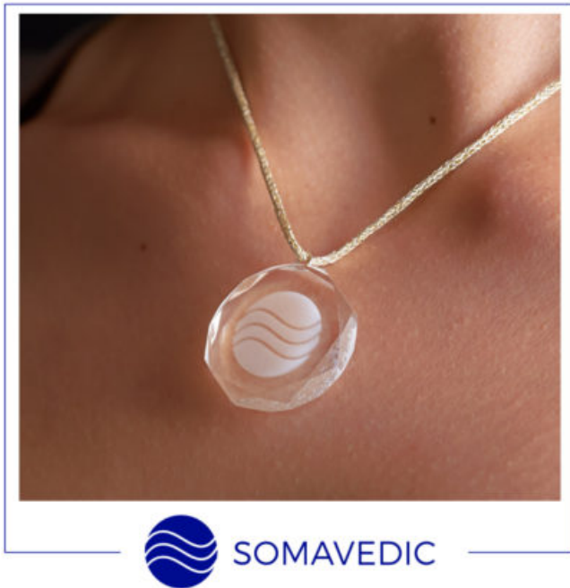
Somavedic Portable Energiefrequenzspeicher - Halsanhänger

Eine richtig aufgeladene Portable Einheit (8 Stunden in der Nacht auf der Lampe positioniert) bietet den ganzen Tag lang effektiven Schutz auf der Zellebene.